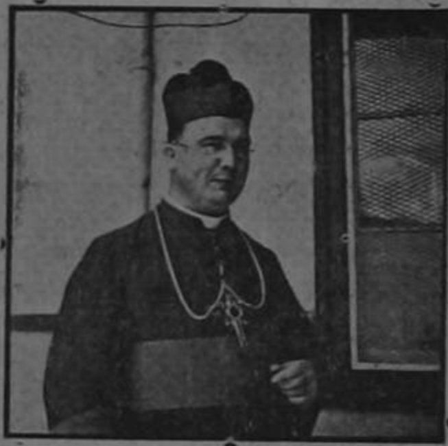
De Limón llegaron cerca de 1.000 personas para asistir a la ceremonia